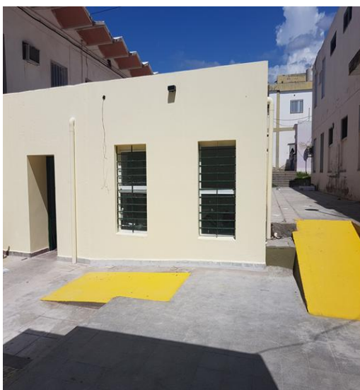
Ilustración 13. Ampliación IDI

Durante el mes de marzo se concluyó la ampliación Instituto de Informática de la Facultad de Tecnología y Ciencias Aplicadas . La obra incluyó la incorporación de 2 nuevas aulas con capacidad para 40 alumnos respectivamente y un box docente . Estos nuevos espacios fueron provisionados con equipamiento informático y de redes , y serán destinados a actividades de académicas y de investigación en el campo de las Tecnologías de la Información y de la Comunicación. La ampliación incorpora a 100 m 2 cubiertos al espacio útil de la Universidad y representa una inversión de $ 750.000.