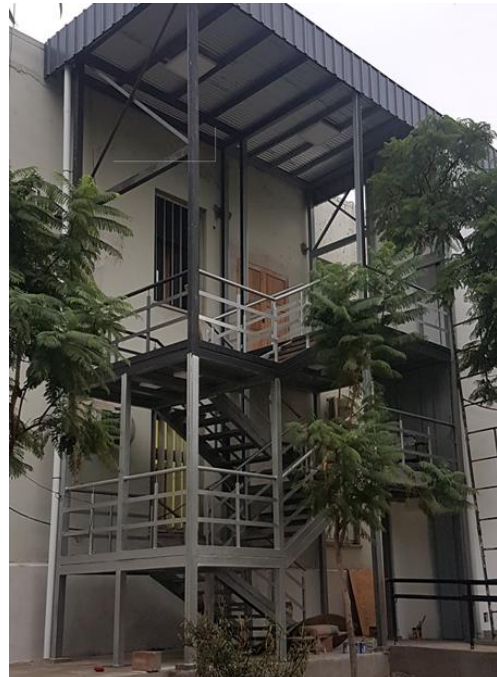
Ilustración 11. Escalera FCEyA

En el caso de la Facultad de Ciencias Económicas y de Administración (FCEyA) , ubicada en el segundo nivel del Edificio Pabellón General Herrera del Predio Universitario de la UNCA , se intervino sobre la accesibilidad arquitectónica y el sistema de evacuación de sus instalaciones.