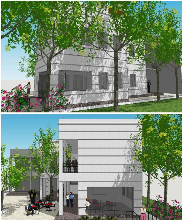
Ilustración 7. Ampliación FTyCA.

La ampliación de Facultad de Tecnología y Ciencias Aplicadas consistirá en la construcción de un nuevo módulo edilicio . El proyecto se desarrolla en dos niveles: En la planta baja se ubicará un espacio destinado a asociaciones estudiantiles y un bar con dependencias de servicio. En la segunda planta se construirá un aula-taller con capacidad para 30 personas, y los laboratorios de Hidrología y Sedimentología . La nueva construcción agregará 200 m 2 a la superficie funcional de la Facultad. La inversión estimada del proyecto es de $3.000.000,00 y se encuentra en etapa de Licitación .