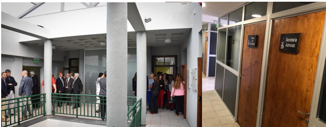
Ilustración 5. Ampliación FCS

También se edificó un sector de oficinas administrativas , el Decanato de la Facultad y dependencias de servicio (sanitarios, sanitario accesible, kitchenette).