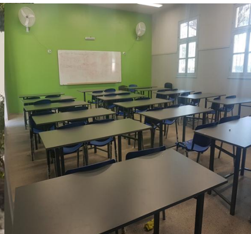
Ilustración 1. Nuevas Aulas ENET N° 1