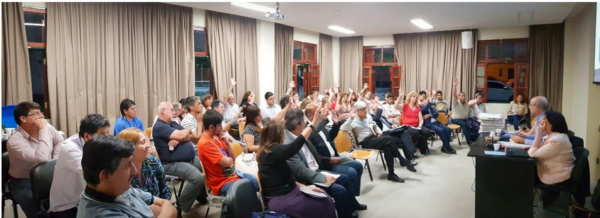
Ilustración 9. Auditorio I. Agrupamiento de Aulas II