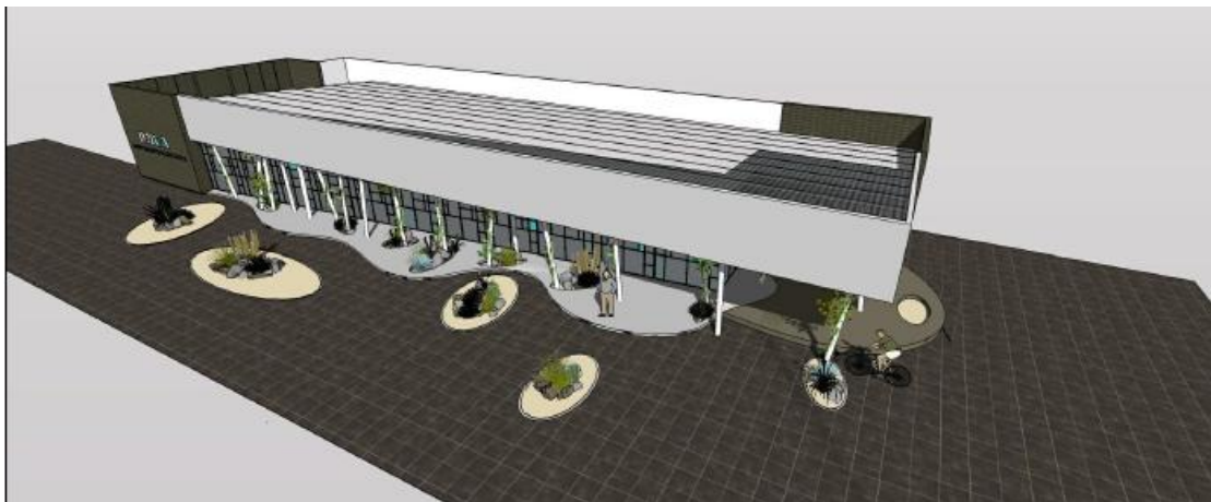
Ilustración 16. Perspectiva Comedor Universitario

El Comedor Universitario brinda servicio durante los cinco (5) días hábiles de la semana, en seis turnos diarios. La asistencia al Comedor de todos los estudiantes de la Comunidad Universitaria se encuentra subsidiada por la Universidad, que solventa el 60% del precio de cada comida. Los beneficiarios del Programa de Becas Comedor asisten en forma completamente gratuita. También concurren habitualmente el personal docente y no docente de la Universidad. En su funcionamiento diario el Comedor presta atención a un promedio 520 personas.