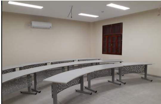
Ilustración 8. Auditorio II. Agrupamiento de Aulas II

Durante el mes de marzo se completó el equipamiento de los dos auditorios de más reciente construcción, en el Agrupamiento de Aulas II . Ambos espacios, destinados al uso común de toda la Comunidad Universitaria , se aprovisionaron con video proyectores de alta definición, pantallas desplegadas, sistema de sonido, conexión de internet de alta velocidad, cortinas y pupitres y mesas de