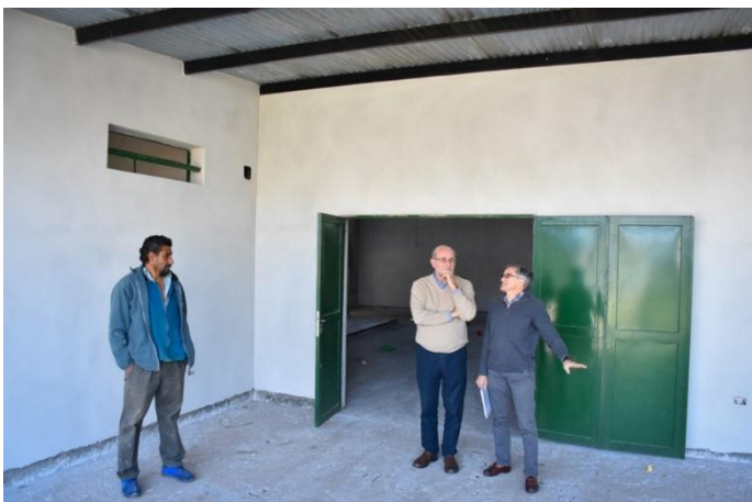
Ilustración 4. Recorrido Obra Sede Los Altos

exposiciones de artesanos y productores locales y actividades culturales diversas .