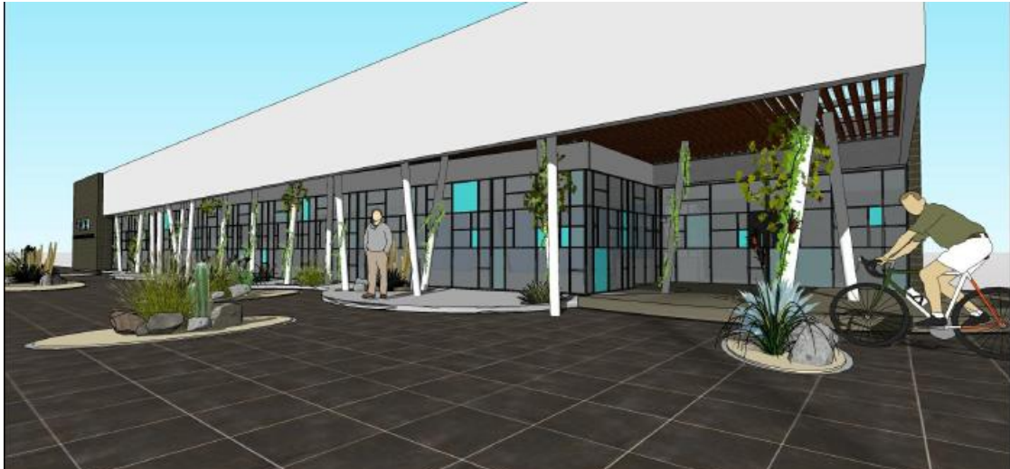
Ilustración 15. Perspectiva Comedor Universitario

En el mes de octubre se iniciará la construcción del Comedor Universitario en el nuevo sector del Predio Universitario ubicado frente a la Plaza del Aviador. El edificio, de 520 m 2 , contará con espacio de comedor , acondicionado y equipado para albergar a 210 comensales . Además, dispondrá de sector cocina, cámara de frío, depósito, zona de lavado y demás espacios requeridos para la preparación del servicio.