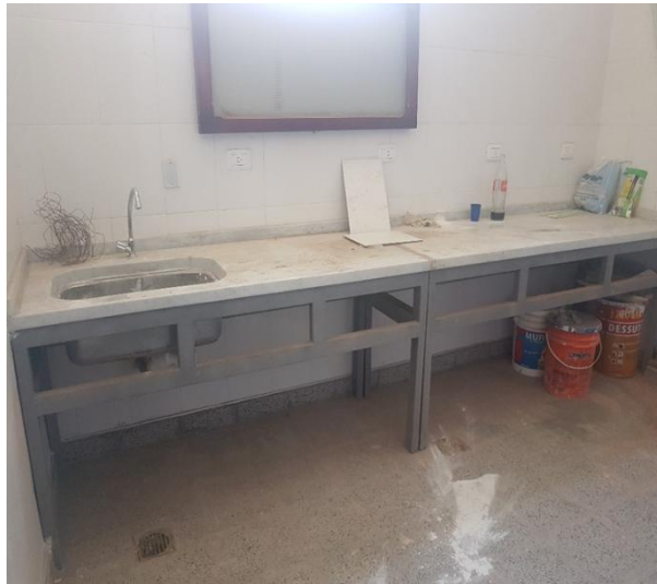
Ilustración 12. Etapa de ejecución de obra. Laboratorio de Suelo.

requeridas para el desarrollo normado de actividades de investigación en la materia.