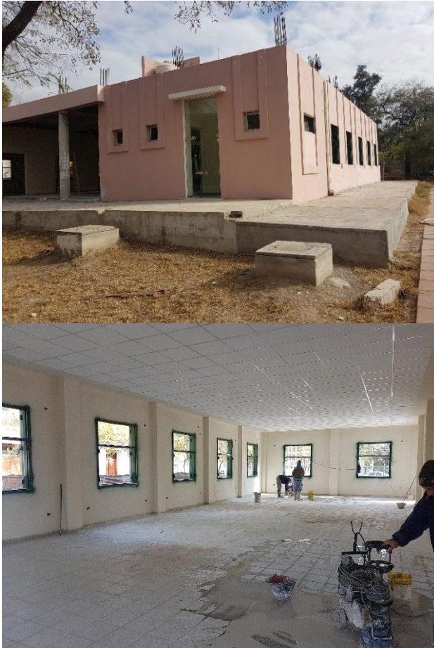
Ilustración 6. Sector Boxes Docentes. FCEyA. Ejecución de Obra

A fin de potenciar las acciones que el cuerpo docente lleva adelante en el marco de las políticas de Investigación y Vinculación con el medio, se proyectó el módulo edilicio de Boxes y Administración de la Facultad de Ciencias Económicas y de Administración .