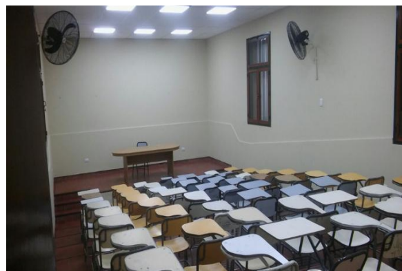
Ilustración 10. Auditorio Virgen del Valle

La intervención en el Auditorio Virgen del Valle incluyó el replazo total de pisos, reparación y pintado de muros, reconstrucción del escenario, y equipamiento con sillas/escritorio y ventiladores y AC. Actualmente, se encuentra disponible para uso común de las Unidades Académicas y tiene capacidad para 70 personas.