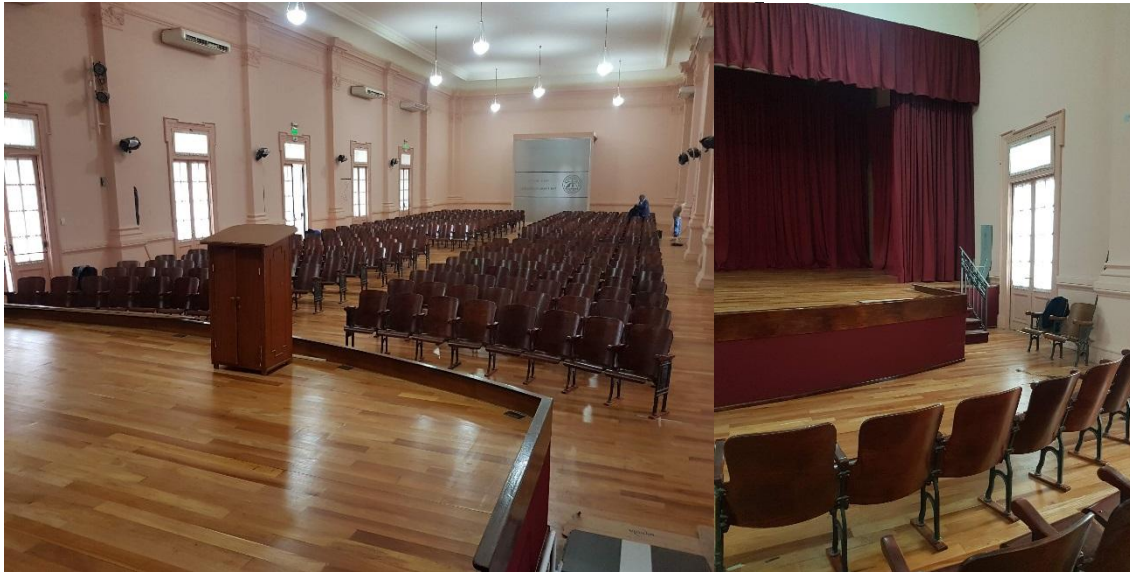
Ilustración 2. Remodelación Aula magna

El 80% de los trabajos ejecutados fueron llevados a cabo por el personal de la Secretaría General incluyendo la configuración e instalación del sistema audiovisual y la confección del nuevo telón.